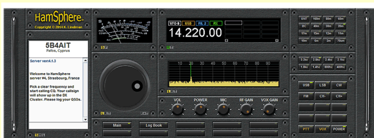
The HamSphere 4.0 Standard Transceiver

Du kan hyra den här den här transceivern för bara EUR 30 per år. Bygg din egen station och sätt igång och kör världen! Mer info finns här: http://hs4.hamsphere.com/info