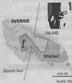
Gränsen på Fyrön liknar en rosett eller fluga.